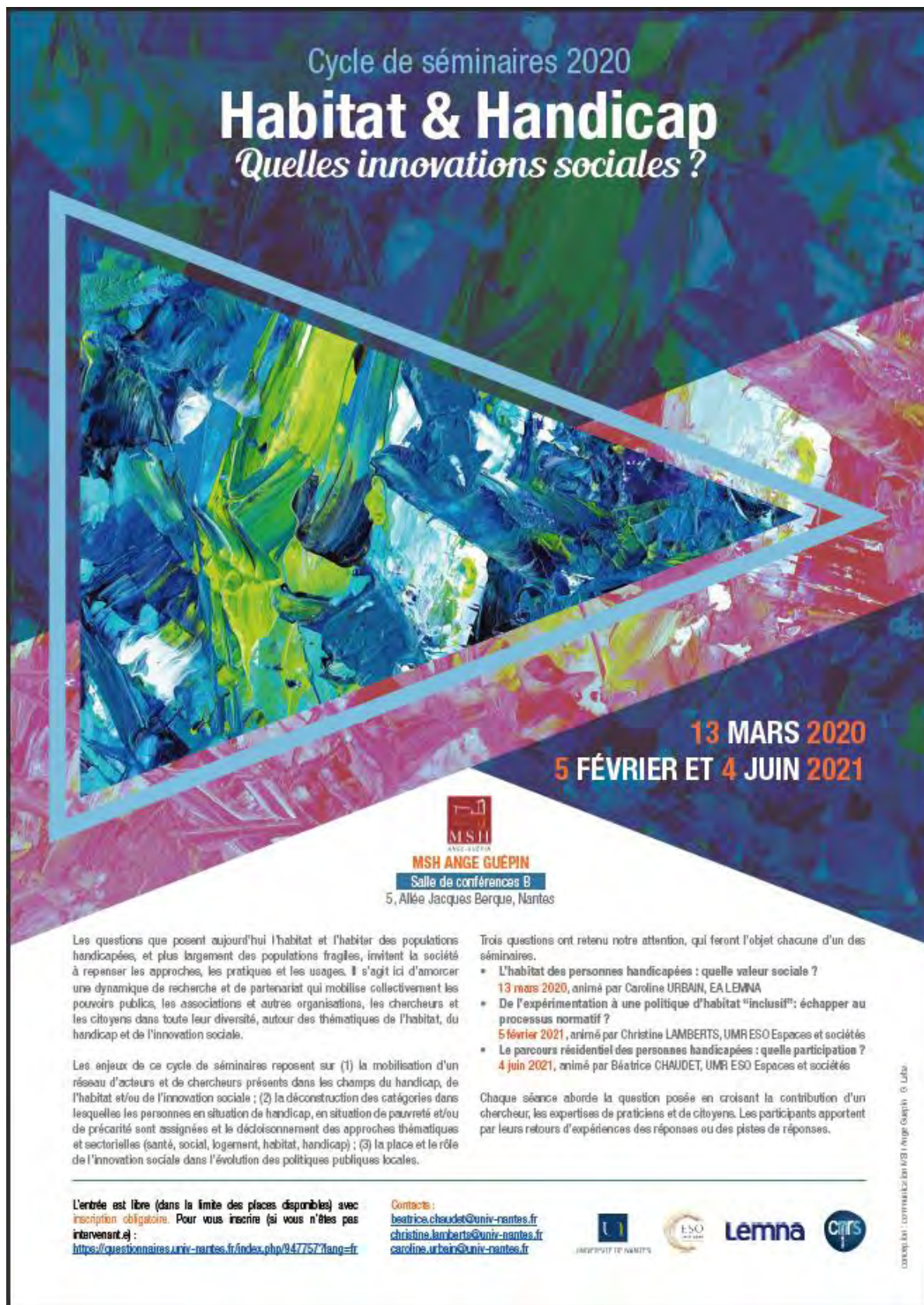
Affiche du cycle de séminaires